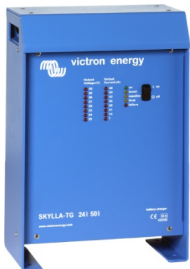
Chargeur Skylla 24 V 50 A