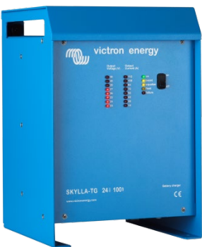
Skylla TG 24 100