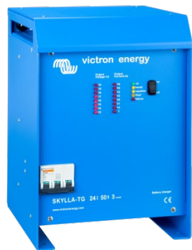
Skylla TG 24 50 3 phase