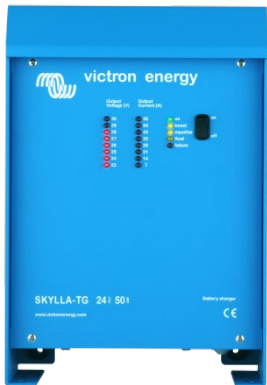
Skylla TG 24 50