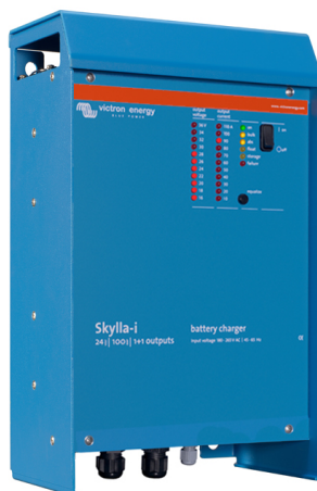
Skylla-i 24/100 (1+1)

Pour de plus amples informations sur les batteries et leurs méthodes de charge vous pouvez consulter notre livre « L'Énergie Sans Limites » (disponible gratuitement chez Victron Energy et téléchargeable sur www.victronenergy.com ).