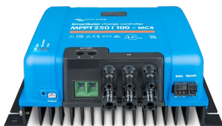
Contrôleur de charge SmartSolar MPPT 150/100 MC4 sans écran