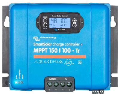
Contrôleur de charge SmartSolar MPPT 150/100-Tr avec un écran enfichable en option