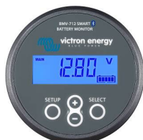
Détection Bluetooth : BMV-712 Smart Battery Monitor