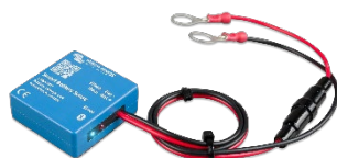
Détection Bluetooth : Smart Battery Sense