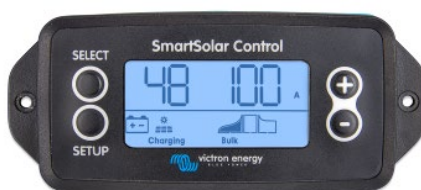
Écran enfichable SmartSolar

Retirer simplement le joint en caoutchouc qui protège la prise sur le devant du contrôleur, et insérer l'écran.