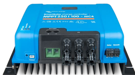
Contrôleur de charge SmartSolar MPPT 250/100 MC4 sans écran