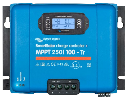
Contrôleur de charge SmartSolar MPPT 250/100-Tr avec un écran enfichable en option