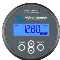
Détection Bluetooth : BMV-712 Smart Battery Monitor